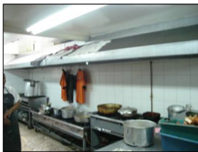
Foto 1. Campana de extracción de las fuentes en la cocina.