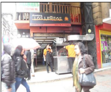
Foto 5. Fachada del establecimiento.