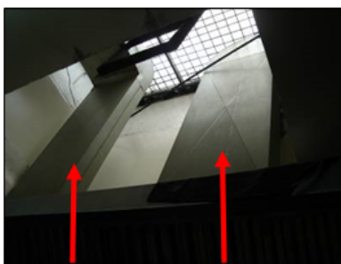
Foto 2. Ducto de extracción da las fuentes de la cocina