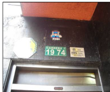
Foto 5. Nomenclatura