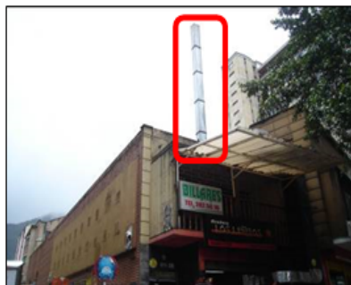
Foto 4. Ducto de extracción de la parrilla de asado de carnes