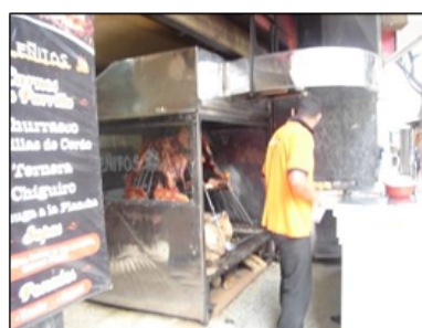
Foto 3. Parrilla de asado de carnes tipo trompo.